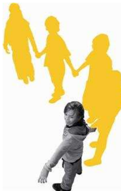
Afbeelding 13: Indicatoren signalering en toeleiding tot hulpaanbod

In 2008 staat 97 procent van de 0 tot 4 jarigen onder controle van het consultatiebureau, dat hun groei en ontwikkeling controleert e . Hiermee is het bereik ten opzichte van 2006 met één procentpunt toegenomen. Andere plekken waar vroegtijdig problemen worden gesignaleerd zijn de kinderdagverblijven en peuterspeelzalen. Van alle kinderen tussen de 0 en 4 jaar gaat 53 procent naar een kinderdagverblijf en van alle kinderen tussen de 2,5 en 4 jaar gaat 44 procent naar een peuterspeelzaal e . Hier is een verandering ten opzichte van 2006 te zien. Toen gingen meer kinderen naar een peuterspeelzaal dan naar een kinderdagverblijf.