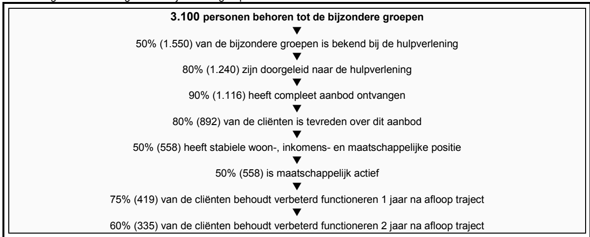
Afbeelding 36: Doelstellingen voor bijzondere groepen in 2010